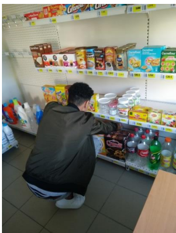
Valorisation et optimisation des produits dans l'espace de vente...

Les jeunes qui intègrent le dispositif peuvent se confronter à la réalité des métiers et mesurer leurs aptitudes et compétences à exercer dans ce secteur professionnel au travers de mises en situation professionnelles diversifiées et en s'appuyant sur un magasin pédagogique.