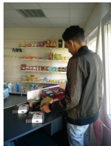
Encaissement des produits...