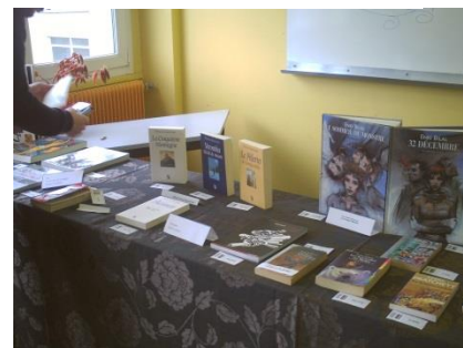
Organisation d'une opération commerciale : « Foire aux livres »...