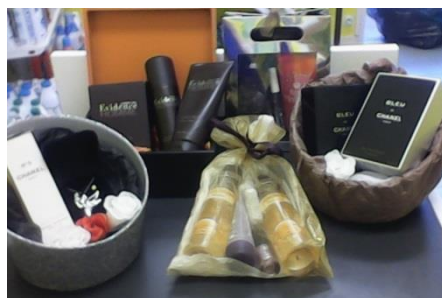
Opération « Fête des mères » : création et mise en place d'un stand autour de produits de beauté, réalisation d'affiches, conseil clients,...